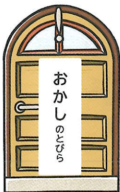
森永製菓株式会社

5つのとびら(ワークショップ)から2つのとびらに さんか 参加します。 参加するとびらは、当日のくじにより けつてい 決定します。