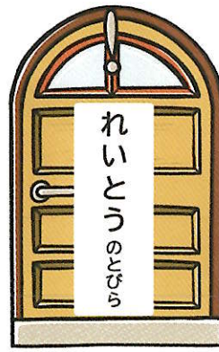
株式会社ニチレイ