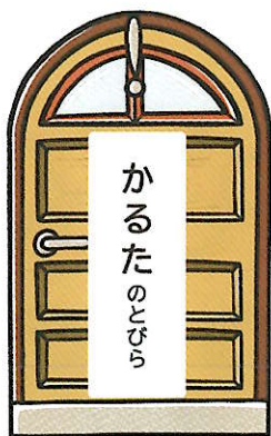
パナソニック インダストリー 株式会社